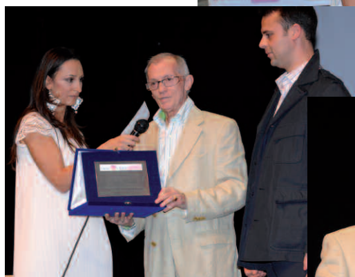
▲ La consegna del premio ►►