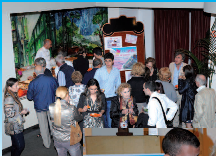
▲ Buffet nell'atrio del teatro